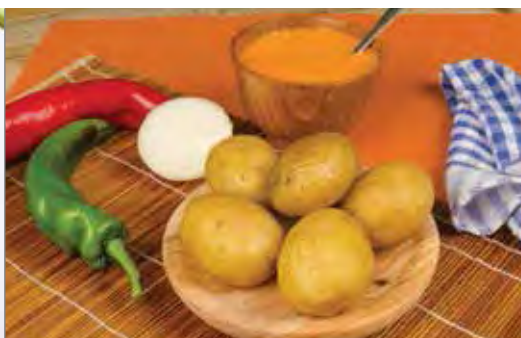
SAUCE SPICY CANARY