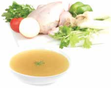
BOUILLON DE VOLAILLE