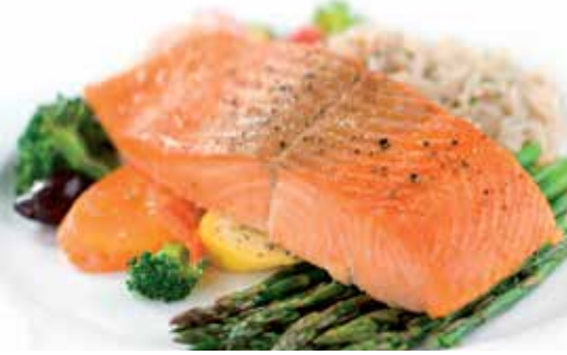
MARINADE POUR POISSON