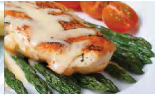
SAUCE AUX FROMAGES