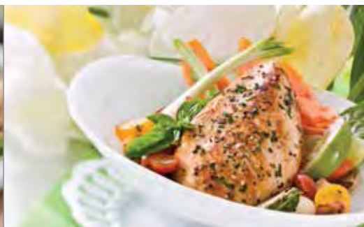
POULET À L'AIL