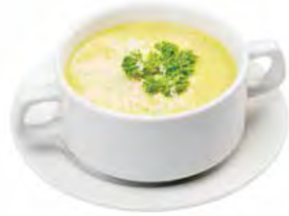
VELOUTÉ DE COURGETTES