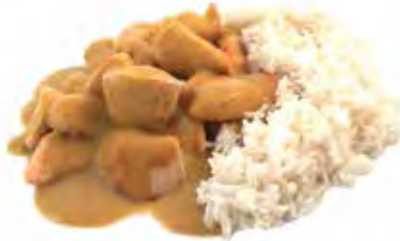
SAUCE AU CURRY