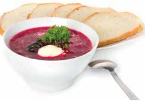
VELOUTÉ DE BETTERAVES