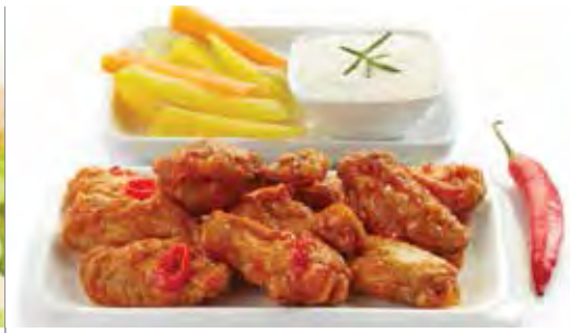
SAUCE AU FROMAGE BLEU