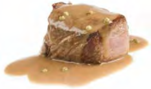
SAUCE AU POIVRE VERT