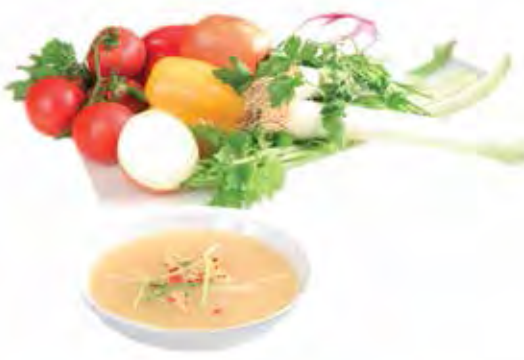
BOUILLON DE LÉGUMES