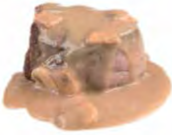
SAUCE AUX CHAMPIGNONS