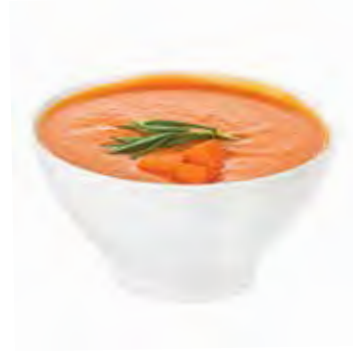
VELOUTÉ DE CAROTTES