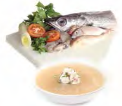
BOUILLON DE POISSON