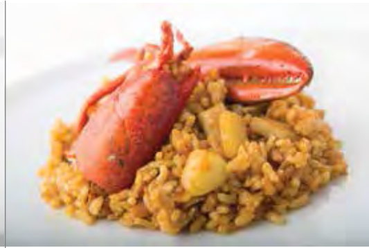
RIZ AU HOMARD