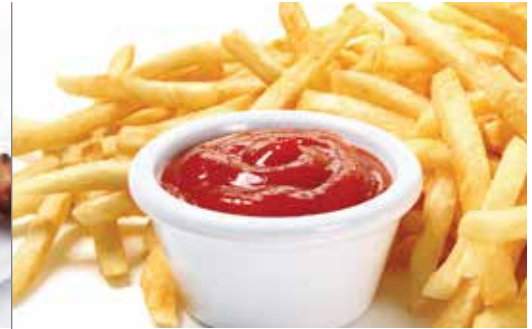
SAUCE TOMATE FAÇON KETCHUP