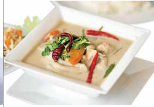
VELOUTÉ DE VOLAILLE