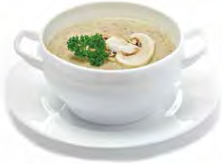
VELOUTÉ AUX CHAMPIGNONS