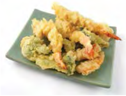
TEMPURLAN. (MÉLANGE POUR TEMPURA)

Tempurlan. ((مزيج للأكلة اليابانية تيمبورا))