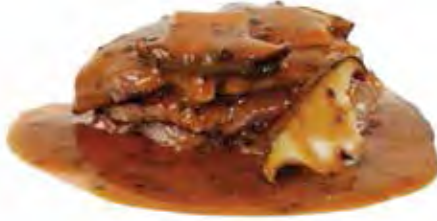
SAUCES AUX CÈPES