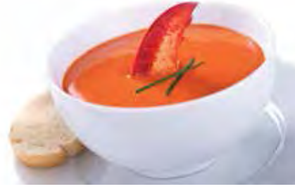
VELOUTÉ AUX FRUITS DE MER