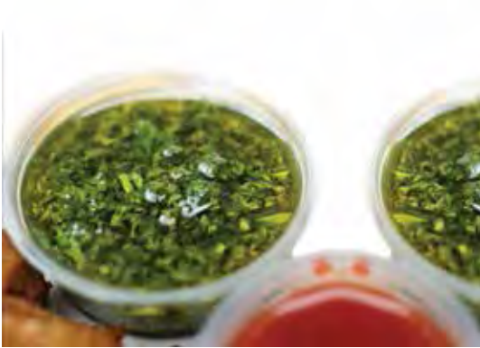
SAUCE VINAIGRETTE CHIMICHURRI DE LA PAMPA