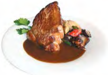
SAUCE AU JUS DE VIANDE ÉPICÉ