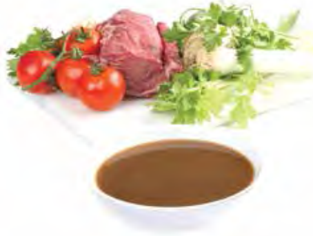
BOUILLON DE VIANDE