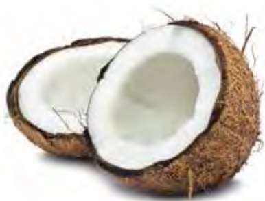
NOIX DE COCO