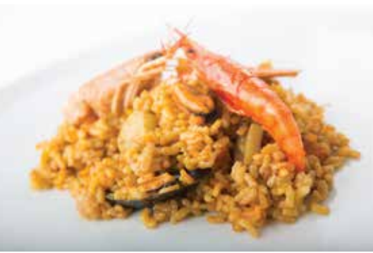
RIZ AUX FRUITS DE MER