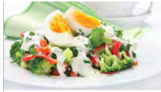
SAUCE AU YAOURT